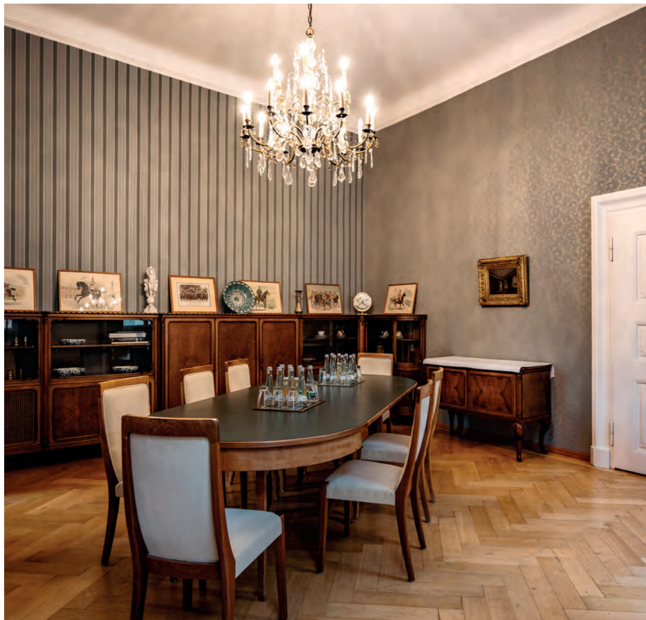
Ein wahres Schmuckstück des Salons ist der große historische Kronleuchter, der dem Raum seine Eleganz verleiht.